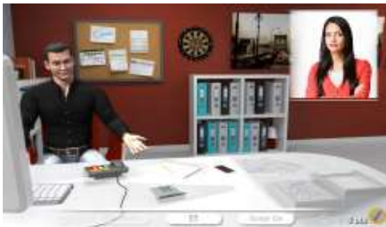
MANAGING A CUSTOMER COMPLAINT