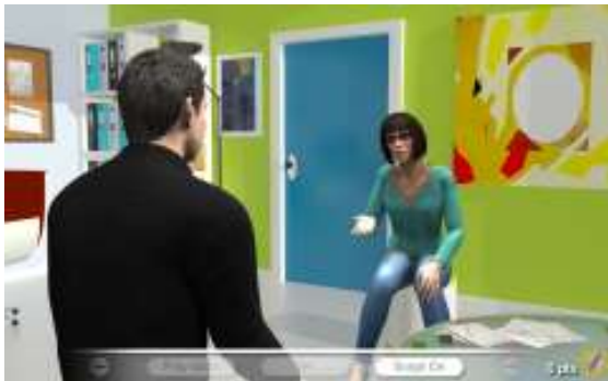
CONDUCTING A PROJECT MONITORING MEETING

Six modules de formation abordant des situations de la vie quotidienne professionnelle sont actuellement disponibles.