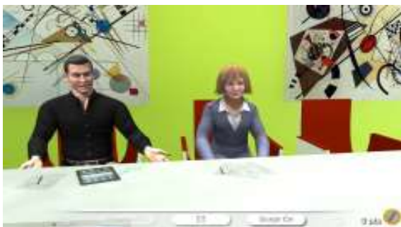
LEADING A MEETING WITH SEVERAL PARTICIPANTS