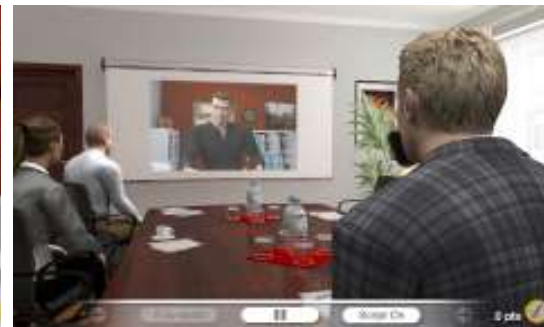
TAKING PART IN A MEETING BY VIDEO CONFERENCE