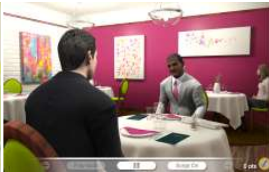
TAKING A BRITISH CLIENT TO LUNCH