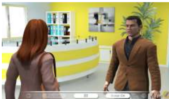
WELCOMING A NEW EMPLOYEE